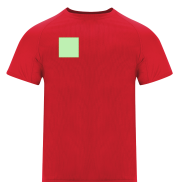
AREA 2 - Area 2