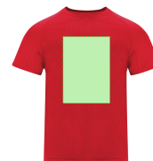
AREA 3 - Area 3