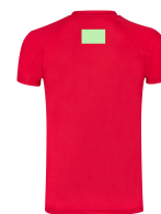
AREA 6 - Area 6