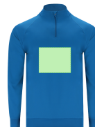
AREA 3 - Area 3