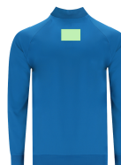
AREA 6 - Area 6