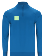
AREA 2 - Area 2