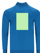
AREA 7 - Area 7