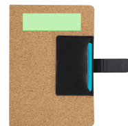
AREA 3 - Area 3