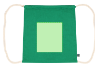
AREA 2 - Area 2