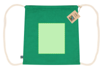
AREA 1 - Area 1

Zones et techniques d'impression disponibles pour cet article. Contactez-nous si vous souhaitez vérifier les différents types de marquage.