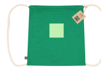
AREA 3 - Area 3