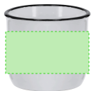
AREA 1 - Area 1

Zones et techniques d'impression disponibles pour cet article. Contactez-nous si vous souhaitez vérifier les différents types de marquage.