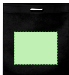
AREA 1 - Area 1

Zones et techniques d'impression disponibles pour cet article. Contactez-nous si vous souhaitez vérifier les différents types de marquage.