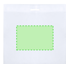
AREA 2 - Area 2