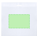
AREA 1 - Area 1

Zones et techniques d'impression disponibles pour cet article. Contactez-nous si vous souhaitez vérifier les différents types de marquage.