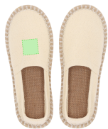
AREA 1 - Area 1

Zones et techniques d'impression disponibles pour cet article. Contactez-nous si vous souhaitez vérifier les différents types de marquage.