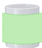
AREA 2 - Area 2