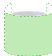
AREA 3 - Area 3