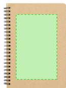
AREA 1 - Area 1

Zones et techniques d'impression disponibles pour cet article. Contactez-nous si vous souhaitez vérifier les différents types de marquage.