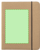
AREA 1 - Area 1

Zones et techniques d'impression disponibles pour cet article. Contactez-nous si vous souhaitez vérifier les différents types de marquage.