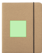
AREA 2 - Area 2