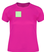
AREA 2 - Area 2