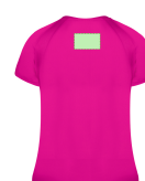
AREA 6 - Area 6