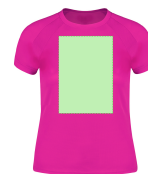
AREA 3 - Area 3