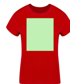
AREA 3 - Area 3