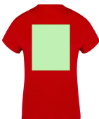
AREA 7 - Area 7