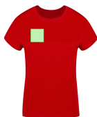
AREA 2 - Area 2