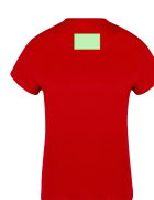
AREA 6 - Area 6