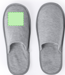
AREA 5 - Area 5