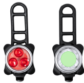
AREA 2 - Area 2