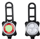
AREA 1 - Area 1

Zones et techniques d'impression disponibles pour cet article. Contactez-nous si vous souhaitez vérifier les différents types de marquage.