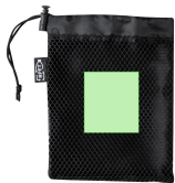
AREA 1 - Area 1

Zones et techniques d'impression disponibles pour cet article. Contactez-nous si vous souhiatez vérifier les différents types de marquage.