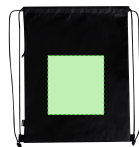
AREA 2 - Area 2