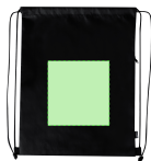
AREA 1 - Area 1

Zones et techniques d'impression disponibles pour cet article. Contactez-nous si vous souhaitez vérifier les différents types de marquage.