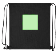
AREA 4 - Area 4