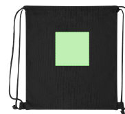
AREA 3 - Area 3