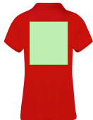
AREA 6 - Area 6