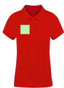
AREA 2 - Area 2