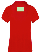
AREA 5 - Area 5