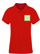
AREA 1 - Area 1

Zones et techniques d'impression disponibles pour cet article. Contactez-nous si vous souhaitez vérifier les différents types de marquage.