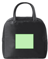
AREA 1 - Area 1

Zones et techniques d'impression disponibles pour cet article. Contactez-nous si vous souhaitez vérifier les différents types de marquage.