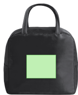
AREA 2 - Area 2