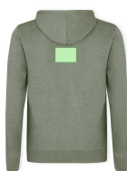
AREA 5 - Area 5