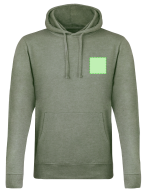
AREA 1 - Area 1

Zones et techniques d'impression disponibles pour cet article. Contactez-nous si vous souhiatez vérifier les différents types de marquage.