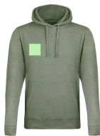
AREA 2 - Area 2