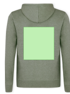
AREA 6 - Area 6