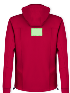
AREA 4 - Area 4