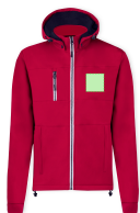
AREA 1 - Area 1

Zones et techniques d'impression disponibles pour cet article. Contactez-nous si vous souhaitez vérifier les différents types de marquage.