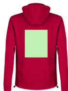
AREA 5 - Area 5