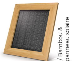
/ Bambou & panneau solaire