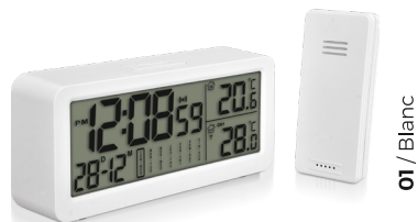
01 / Blanc