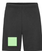
AREA 2 - Area 2