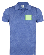
AREA 1 - Area 1

Zones et techniques d'impression disponibles pour cet article. Contactez-nous si vous souhaitez vérifier les différents types de marquage.