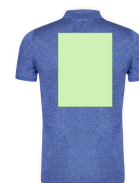
AREA 6 - Area 6