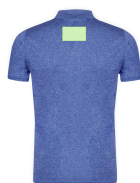
AREA 5 - Area 5