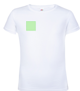
AREA 2 - Area 2