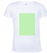
AREA 3 - Area 3