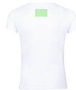
AREA 6 - Area 6