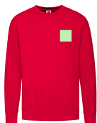
AREA 1 - Area 1

Zones et techniques d'impression disponibles pour cet article. Contactez-nous si vous souhaitez vérifier les différents types de marquage.