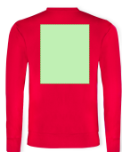
AREA 7 - Area 7