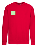
AREA 2 - Area 2