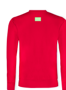
AREA 6 - Area 6