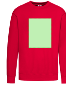
AREA 3 - Area 3