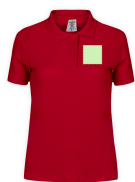
AREA 1 - Area 1

Zones et techniques d'impression disponibles pour cet article. Contactez-nous si vous souhaitez vérifier les différents types de marquage.