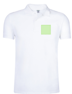
AREA 1 - Area 1

Zones et techniques d'impression disponibles pour cet article. Contactez-nous si vous souhaitez vérifier les différents types de marquage.