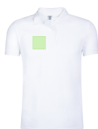
AREA 2 - Area 2