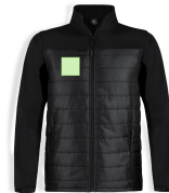
AREA 3 - Area 3