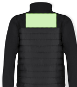
AREA 8 - Area 8