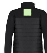
AREA 7 - Area 7