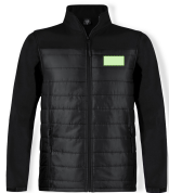
AREA 2 - Area 2