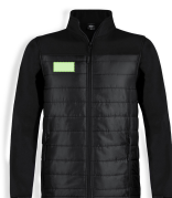
AREA 4 - Area 4