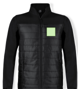
AREA 1 - Area 1

Zones et techniques d'impression disponibles pour cet article. Contactez-nous si vous souhaitez vérifier les différents types de marquage.