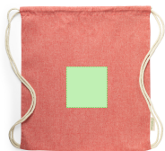
AREA 2 - Recto A