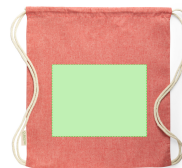
AREA 3 - Cara B