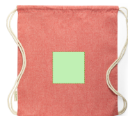
AREA 4 - Cara B