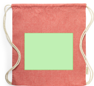
AREA 1 - A côté

Zones et techniques d'impression disponibles pour cet article. Contactez-nous si vous souhaitez vérifier les différents types de marquage.