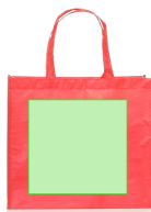
AREA 2 - Cara B