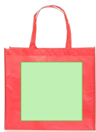
AREA 1 - Recto A

Zones et techniques d'impression disponibles pour cet article. Contactez-nous si vous souhaitez vérifier les différents types de marquage.