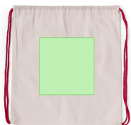
AREA 1 - A côté

Zones et techniques d'impression disponibles pour cet article. Contactez-nous si vous souhaitez vérifier les différents types de marquage.