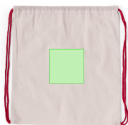
AREA 2 - A côté