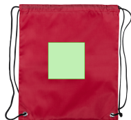
AREA 1 - A côté

Zones et techniques d'impression disponibles pour cet article. Contactez-nous si vous souhaitez vérifier les différents types de marquage.