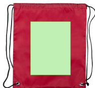
AREA 2 - Recto A