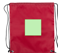
AREA 3 - Cara B