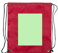
AREA 4 - Cara B