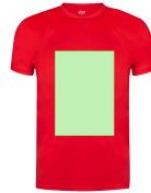
AREA 3 - Area 3