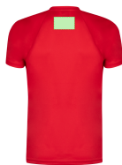
AREA 6 - Area 6