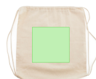
AREA 3 - Cara B