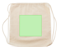
AREA 1 - A côté

Zones et techniques d'impression disponibles pour cet article. Contactez-nous si vous souhaitez vérifier les différents types de marquage.