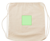
AREA 2 - A côté