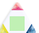
AREA 6 - Area 6