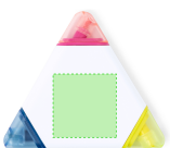
AREA 5 - Area 5