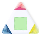
AREA 3 - Area 3