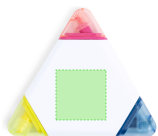
AREA 4 - Area 4