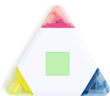
AREA 2 - Area 2